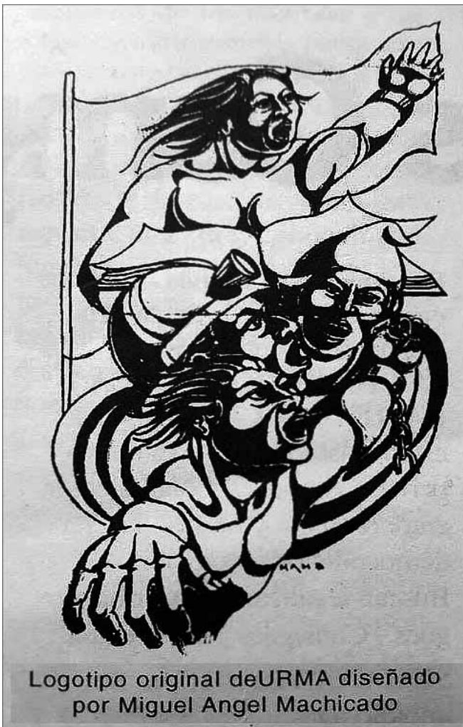
Logotipo original de URMA diseñado por Miguel Ángel Machicado

La pugna mayor se dio entre el frente oficialista Magisterio U y el frente trotskista URMA que se impuso en las mismas logrando la representación con cinco delegados.